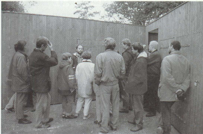
BSH-Besuch in der Auffangstation Rastede-Wahnbek. Geschlossene Volieren (im Hintergrund) verhindern die Gewöhnung der Pfleglinge an den Menschen.

Entfernung, um nicht auf das Kitz aufmerksam zu machen), und ein im Spätherbst angetroffener junger Igel wird nicht notgedrungen dem Hungertod sterben, wenn er nicht ins Haus geholt wird. Besser ist es, den Tieren im Garten Möglichkeiten zum Überwintern zu bieten (Laub- und Komposthaufen) und ihnen falls notwendig zusätzliches Futter zu reichen (Akkermann u. a., 1992).